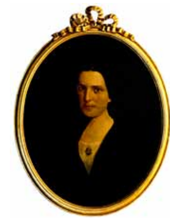
Adriana Billini Gautreau 1863 - 1946 Retrato , Ca. 1920 Óleo sobre tela, 40.6 x 33 cm