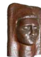
José Vela Zanetti 1913 - 1999 Cabeza , Sin fecha Talla en caoba, 43 x 33 x 16 cm