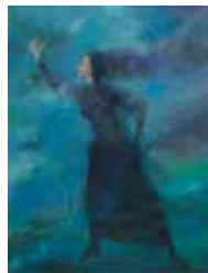
Ramón Oviedo 1927 Paloma , Sin Fecha Acrílica sobre tela, 91.5 x 117 cm