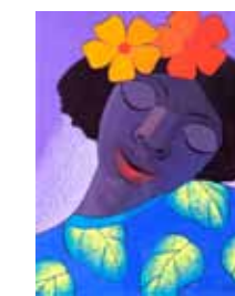
Francisco Santos 1949 Mujer , Ca. 1980 Óleo sobre tela, 100 x 125.5 cm