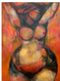
Servando Cabrera Moreno 1923 - 1981 Homenaje al Gran Mamey , 1973 Óleo sobre tela, 150 x 197 cm