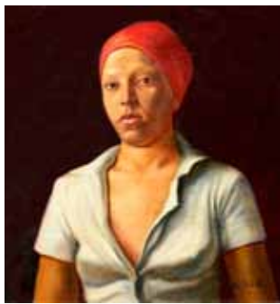
León Bosch 1936 Muchacha , 1976 Óleo sobre tela, 46 x 49.5 cm