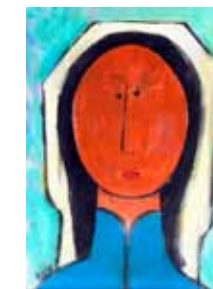
Alberto Ulloa 1950 Sin Título , Ca. 1977 Óleo sobre tela, 75 x 100 cm