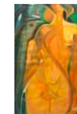
Fernando Ureña Rib 1951 Edén , 1974 Óleo sobre tela, 67.5 x 100 cm