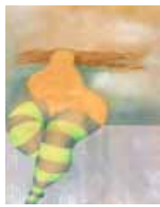
Teté Marella 1943 Sin Título , Ca. 1980 Lápiz de color y pastel sobre papel, 56 x 71 cm