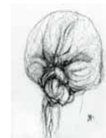
Aquiles Azar 1932 La Trenza , 1989 Tinta sobre tela, 38 x 48 cm