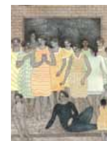
Barón Arias 1955 Sin Título , 1983 Mixta sobre papel, 44.5 x 58 cm